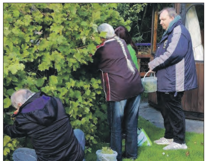
Bei der Weinlese.