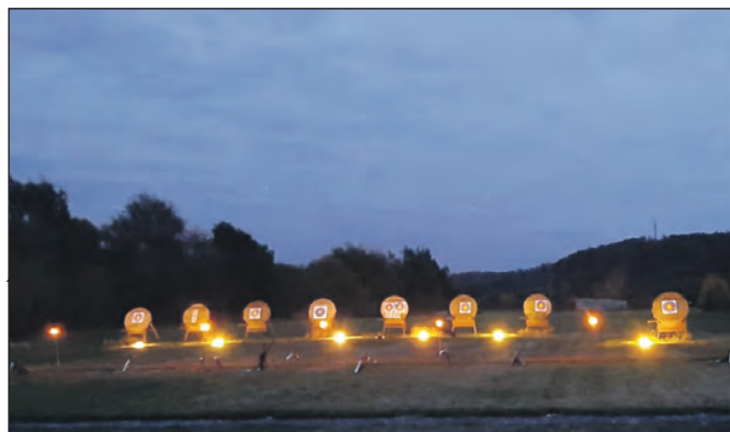
... bei Einbruch der Dunkelheit.