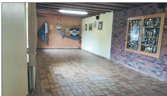
In neuem Glanz erstrahlt der Schießstand nach den Renovierungsarbeiten.