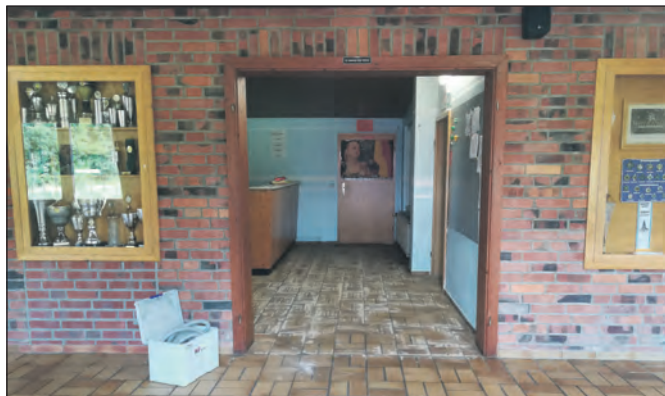
Der alte Belag des Schießstandes.

... allen Kameradinnen und Kameraden, die Geburtstag haben oder ein Jubiläum feiern. Unseren erkrankten Kameradinnen und Kameraden wünschen wir baldige Genesung.