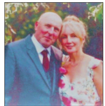
Das glückliche Brautpaar.

Es war, trotz Corona, eine wunderschöne Feier. Bereits am 10.07. fand der Polterabend statt und am Sonntag, den 12.07. klangen die Feierlichkeiten mit einem Frühstücken aus. Es war eine rundum gelungene Hochzeit. Die KK Bothkamp wünscht den beiden alles erdenklich Gute für die gemeinsame Zukunft. Ernst-August Siebke