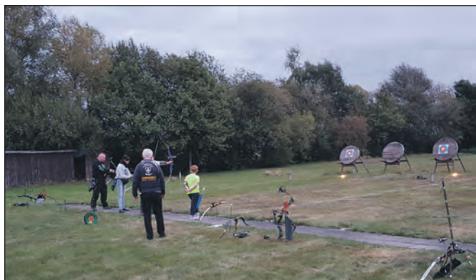
Die Bogenschützen der Kyffhäuser Kameradschaft Wulften...

Es wäre auch möglich, die zu betreuenden Gebiete des Pressereferenten in Nord und Süd aufzuteilen, um so den Aufwand so gering wie möglich zu halten.